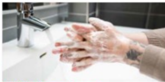
4. Fläta ihop fingrarna och gnugga