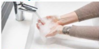
5. Skölj händerna med rikligt med vatten