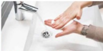
2. Använd tvål och gnugga handflatorna mot varandra