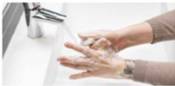
3. Gnugga även händernas ovarsidor, tummarna och mellan fingrarna