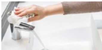
7. Stäng kranen med pappershandduken