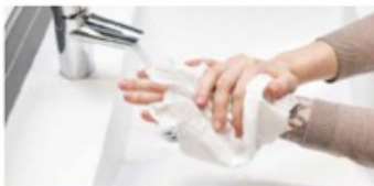
6. Torka händerna noggrant med en pappershandduk