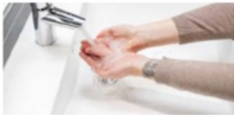
1. Skölj händerna med rikligt med vatten